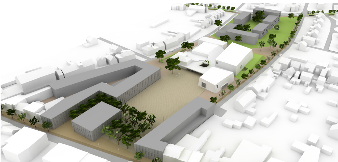
Ontwerp voor nieuwe cultuurplein annex randbebouwing, tussen het cultureel centrum en de winkelstraat